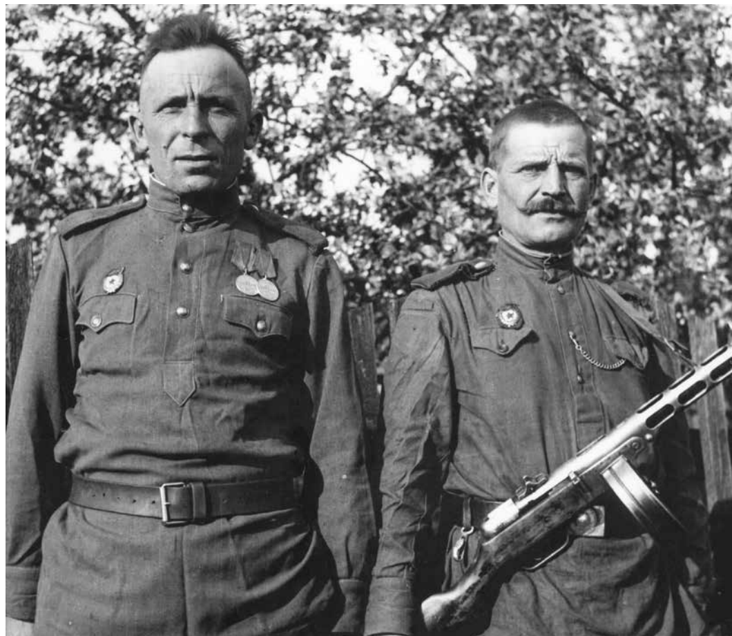
Vojáci Rudé armády ve Frýdku, začátek května 1945.

Jak se tedy vše seběhlo? Co tyto zápisy spojuje, je popis ústupu německé armády z této oblasti, příchod vojáků Rudé armády do Raškovic, ustavení Národního výboru v obci a převzetí moci ze strany místních obyvatel. Poslední větší průchod německých vojsk Raškovicemi byl 4. května 1945 v odpoledních hodinách, odchod německých vojáků byl dovršen řízenou detonací a poškozením železného mostu kardinála Koppa přes řeku Morávku dne 5. května 1945, patnáct minut po půlnoci. Už o páté hodině ranní téhož dne