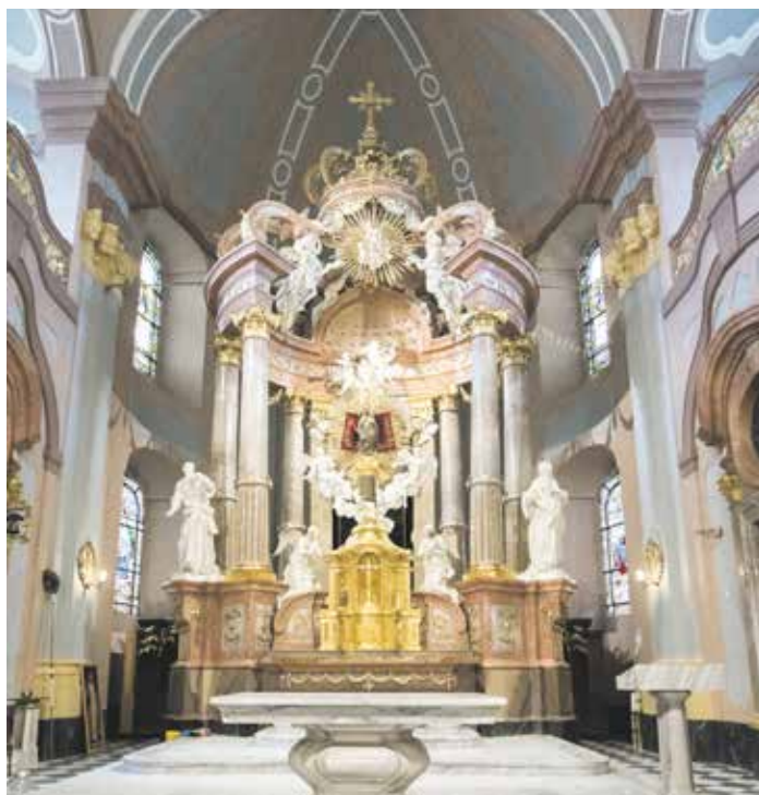
Významných změn se dostalo nové barevnosti výmalby baziliky.