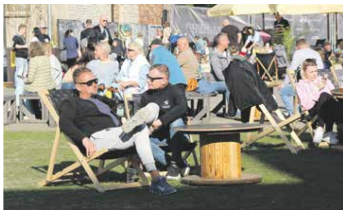
Foto | 1x Člověk a Věra, Jaroslav Maslowski | 9x Jiří Vítězslav Sachr

FRÝDECKO≈MÍSTECKÝ PATRIOT vychází s podporou statutárního města Frýdek-Místek.