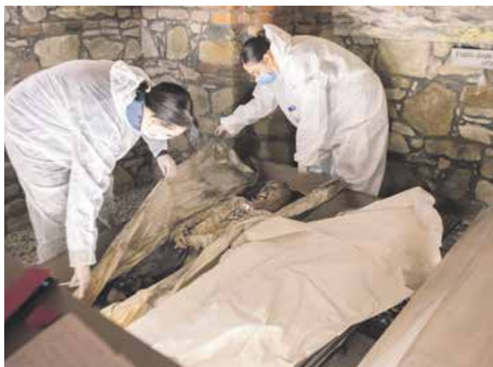
V průběhu rekonstrukce bylo třeba zajistit i specialisty na restaurování mumifikovaných lidských těl a ostatků.

Celkové náklady doposud dosáhly 46 milionů korun. Z dotace programu IROP Evropské unie se podařilo zajistit asi 32,2 milionu korun, Moravskoslezský kraj přispěl 5,6 milionu korun a město Frýdek-Místek poskytlo 4 miliony korun. Zbývajících 4,2 milionu korun leží na bedrech frýdecké farnosti, která za tím účelem vyhlásila veřejnou sbírku. Na tu se nám prozatím podařilo získat 1,1 milionu. Pokud můžete a chcete podpořit obnovu baziliky ve Frýdku, je tak možné učinit formou daru na transparentní účet