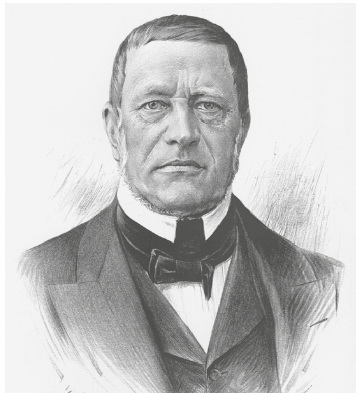
Jan Vilímek: František Palacký