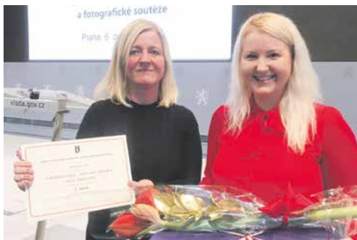
Za podcast S dobrou vůlí získala v roce 2024 Cenu VVOZP Úřadu vlády. Umístila se na 1. místě v rozhlasové kategorii.

Jsem ráda, že jste mi položil právě tuto otázku. Jen v tomto týdnu, kdy spolu děláme náš rozhovor, jsme uspořádali celkem devět besed na základních školách v Lískovci a v Novém Jičíně. Zrovna dnes jsem byla ve městě klobouků, kde jsme s kolegy