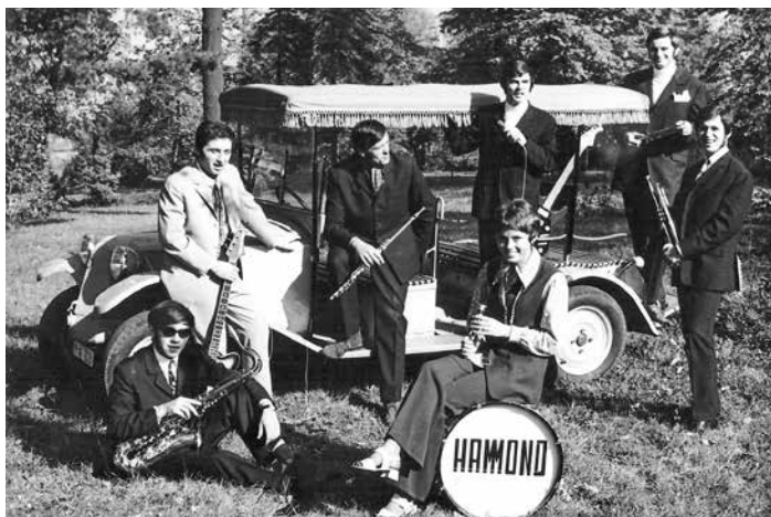
Na konci 60. let minulého století patřila skupina Hammond ke špičkovým hudebním tělesům v regionu.