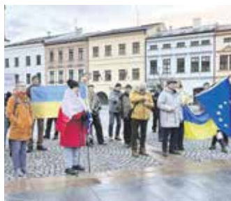
Také letos si lidé připomínali ruskou agresi na Ukrajině.

Na náměstí Svobody v Místku se v podvečer 24. února sešlo několik desítek lidí, aby si připomněli čtvrté výročí napadení Ukrajiny ruským agresorem. Pietní setkání uspořádal Demokratický klub ve Frýdlantu nad Ostravicí a neslo se ve znamení solidarity s oběťmi války i podpory lidí, kteří museli opustit své domovy. Součástí programu byly písně Karla Kryla,