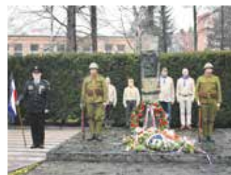
Každoročně stojí na čestné stráži u památníku skauti a členové ČsOL.

Tradičně každý rok se scházejí zástupci města Frýdku-Místku a Československé obce legionářské k pietní vzpomínce na statečné obránce Czajankových kasáren – příslušníků 8. pěšího pluku „Slezského“, kteří se 14. března 1939 postavili přesile německých vojsk, která zahájila okupaci Československa. Letos v sobotu 14. března v 16 hodin na Hlavní třídě v Místku připomeneme již 87. výročí této neblahé historické události, která na dlouhých šest let poznamenala celý československý národ. ■