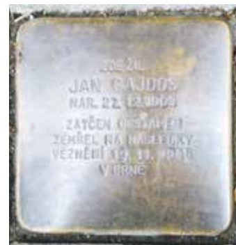
Kámen zmizelých připomínající zatčení a smrt Jana Gajdoše.

Gajdošovu ulici nalezneme ve frýdecké části města. Je to poklidná ulice obklopená rodinnými domy, poblíž autobusové zastávky MHD Válcovny plechu-autobusové nádraží. ■