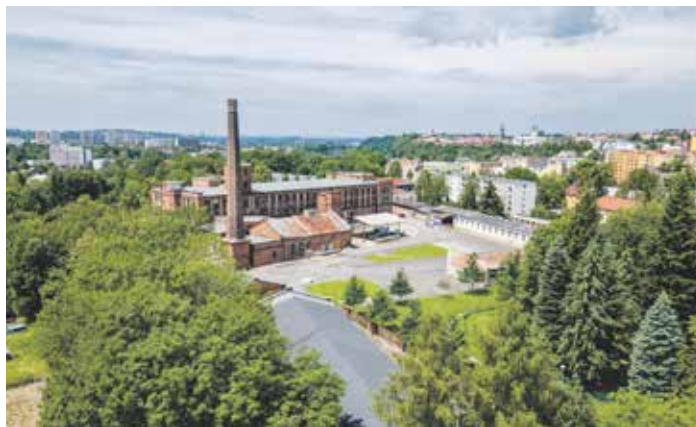
Z Osmičky na Staroměstské ulici se má stát kulturní centrum.

Slezan vnímá memorandum jako zásadní bod obratu ve