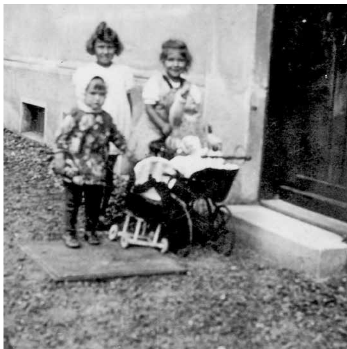
Obě sestry si společně s kamarádkou hrály s panenkami u dveří na zahradu. (cca 1943)

Velmi si potrpěla na čistotu a pořádek. Chtěla, abychom vždy vypadaly jako ze škatulky. Musely jsme nosit zářivě bílé štramply, do vlasů jsme měly vpletenou mašli a bylo zle, když jsme se někde umazaly nebo přišly pozdě. To se