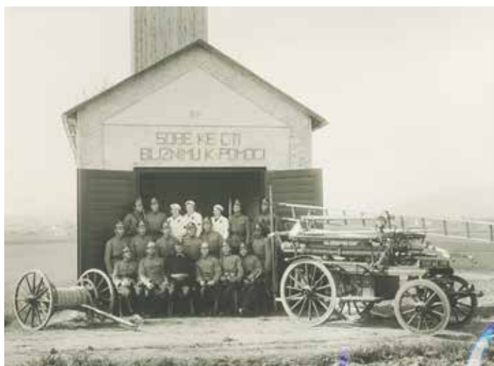
Prvorepublikový sbor dobrovolných hasičů na Panských Nových Dvorech.