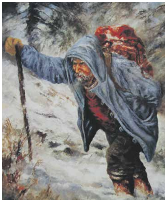
Pod vrcholem Lysé hory je Satinův obraz, který namaloval pod sílou vlastního prožitku.

To, co jsem zachytil štětcem, jsou všechno skuteční lidé a jejich životy – sedláci, horalé, robota na polích i jejich chaloupky, jak si je pamatuji z dětství nebo pozdějších let. Třeba k tomuto obrazu (ukazuje na jednu ze svých olejomalb na stěně) se váže legenda z doby, kdy jsme jezdili do okolí na trampy. Naplánovali jsme si cestu do Zadních hor. Spali jsme na Bobku kousek od Bumbálky a brzo ráno, když jsem se probudil, krajina byla ještě v oparu, vidím – chlap v černém rubáši, šedivé dlouhé vlasy a fousy, jak kráčí s kytkou ke kříži pod zlomeným smrskem. Chvilí u něj postál, položil květiny a v tichosti odešel. Od místních jsem se pak v hospodě dozvěděl, že před více než šedesáti lety v tom místě udeřil od