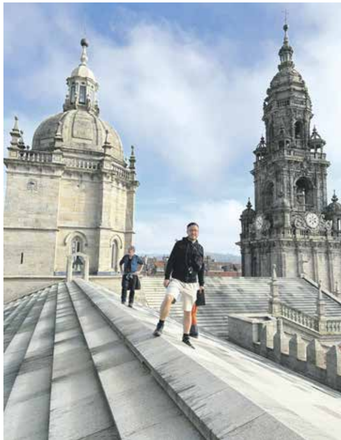
Ze střechy katedrály sv. Jakuba máte celé město Santiago de Compostela jako na dlani.