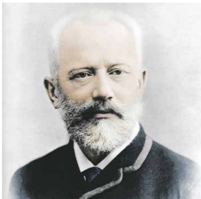
Petr Iljič Čajkovský

Petr Iljič Čajkovský se narodil 7. května 1840 v Rusku na Urale do rodiny báňského inženýra, tehdy ředitele školy. Jeho zájem o hudbu a hudební nadání bylo v rodinném prostředí podporováno, ale další právnické studium v Petrohradě mu mělo zajistit odpovídající zaměstnání státního úředníka. Zájem o hudbu se prohluboval, a tak se nakonec po roce 1861 stal opět studentem, a to jedním z prvních na petrohradské konzervatoři. Po úspěšném ukončení se stal hudebním skladatelem „z povolání“. V devadesátých letech 19. století podnikal turné po Evropě a Americe. Ocenění dostal v Paříži, Cambridge i v Petrohradu z rukou samotného ruského cara. Byl velmi pracovitý, některé své skladby i předělával. Zemřel náhle 6. listopadu 1893 v Petrohradu, kde je také pohřben.