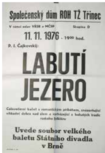
Plakát na uvedení Čajkovského baletu Labutí jezero

Louskáček či Šípková Růženka; skládal pro klavír, komorní orchestry až po drobné cvičné skladby pro děti. ■