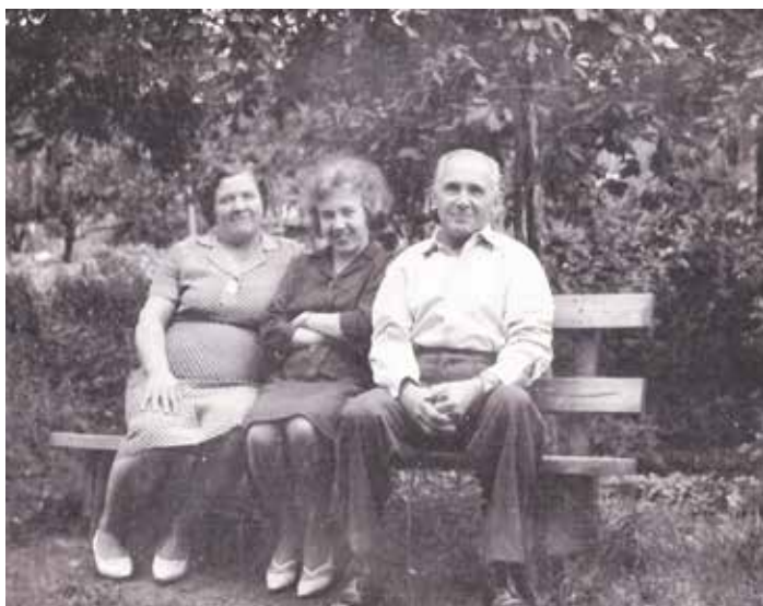
Společně s rodiči na zahradě domu.

Takto to ale nebylo. Troušili se každý sám, podle toho, kdo měl jakou pracovní směnu. V huti byl třisměnný provoz. Otec byl zámečnickem, u nich se to také točilo – ranní, odpolední, noční, pořad dokola. Když býval na noční směně, mívala matka strach, aby k nám někdo nevlezl otevřeným oknem z ulice. Na případného vetřelce měla připravenou past. V bytě postavila pod okno roztažený deštník a na něj poskládala pokličky z hrnců. Aniž by se k nám někdo takto vloupal, jednoho večera se všechny sesypaly. To byl randál! Byli jsme vylekaní, krve by se v nás