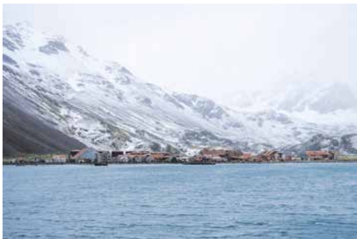
Jižní Georgie – osada Stromness.