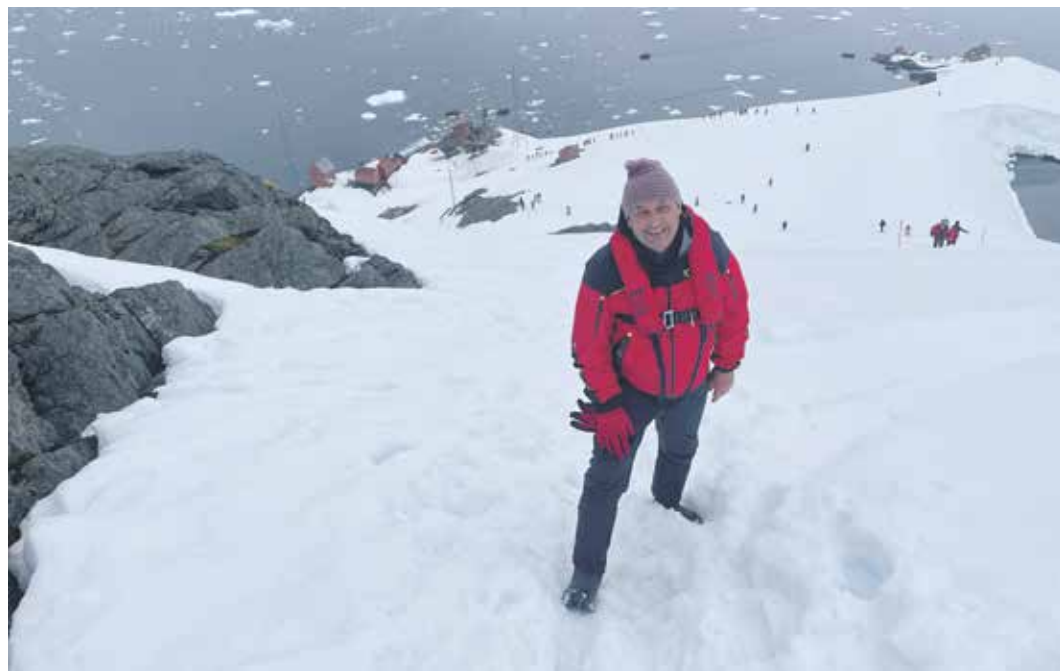
Nad argentinskou stanicí Base Brown, která se stala místem první vraždy na antarktickém kontinentě.

Nejdříve jsme se počátkem listopadu potápěli s přáteli mezi velrybami u ostrova Atauro, který je součástí Východního Timoru, asi čtyři sta kilometrů severně od Austrálie. Byl to zážitek, kdy si ve společnosti téměř dvacetimetrových velikánů plejtváka obrovského, vorvaně a dalších druhů velryb člověk uvědomí svou nicotnost. Jsou to chvíle, pro které stojí za to žít. Za ta léta mám za sebou podobných ponorů více, ale toto mě zkrátka nikdy neomrzí... Na zpáteční cestě do Evropy jsme si udělali ještě zastávku na Bali, krátký pobyt doma