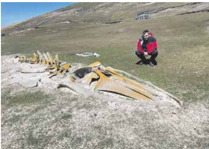
Kostra velryby na pobřeží falklandského ostrova Danco Island.