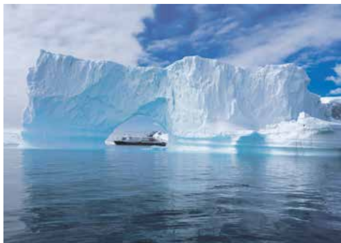
Loď Hondius v ledovcovém okně u ostrova Cuverville na Antarktidě.