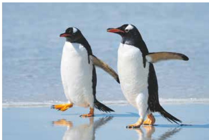
Tučňáci oslí vydávají silný hýkavý hlas.