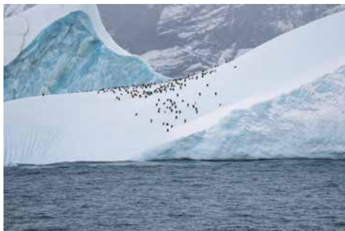
Antarktida – Danco Island, který je obydlen početnými koloniemi tučňáků uzdičkových.