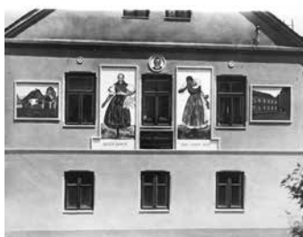
Rodný dům Pavla Křížkovského v Holasovicích.

Pavel (Karel) Křížkovský se narodil jako nemanželský syn do chudých poměrů v Holasovicích u Opavy 9. ledna 1820. Díky podpoře příbuzných a přátel mohl studovat na opavském gymnáziu a i filozofii v Olomouci, jejíž studium na čas právě kvůli nedostatku financí přerušil, a dva roky učil v Jamnici u Holasovic. Pak se ke studiu filozofie vrátil, ovšem v Brně. Zde se díky přátelům, např. Františkovi Matoušovi Klácelovi a Františkovi Sušilovi, seznámil s politickým, společenským a kulturním děním.