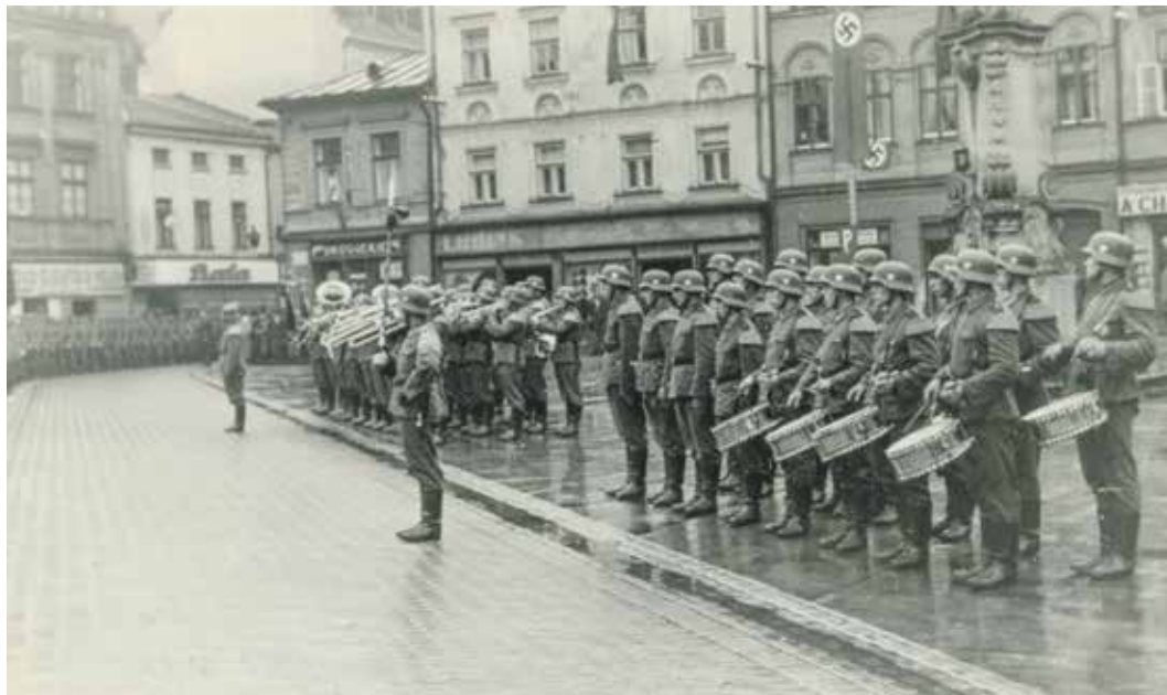
Vojáci wehrmachtu na místeckém náměstí v roce 1941.

Od roku 1942 Herber započal s modernizací podniku, cílem bylo zracionalizování výroby. Zmodernizoval zastaralé strojní zařízení především v přípravně, barvirmě a úpravně, v tkalcovně vyřadil 144 mechanických stavů a část z nich nahradil pěti plnoautomaty a 60 nástavnými automaty