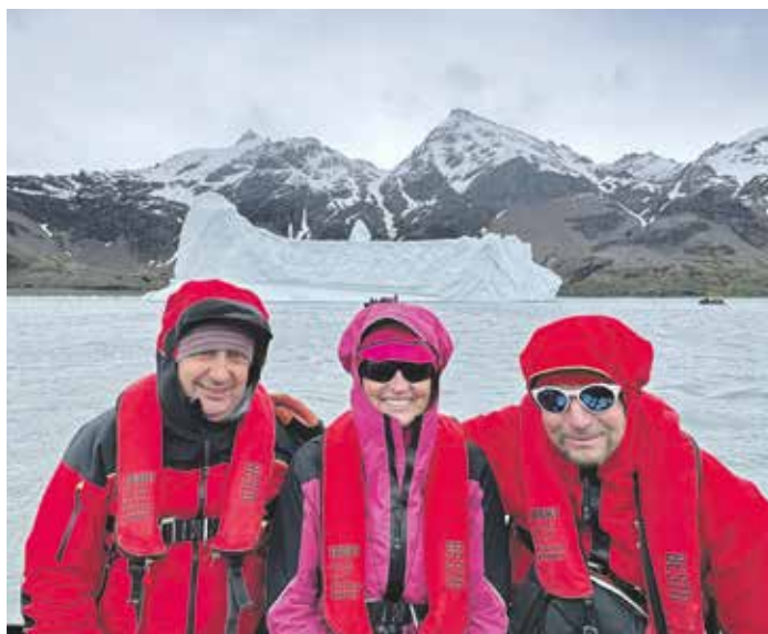
Jižní Georgie – na zodiaku před plovoucí krou ve Fortuna Bay.

Ochrane přírody se vše podřizuje. Okamžitě po vstupu na palubu lodi jsme byli proškoleni o všem, co není povoleno a jak se na pevnině chovat. Nafasovali jsme od posádky boty, ve kterých jsme mohli vstoupit na pevninu, a kancelářské sponky, s jejichž pomocí jsme odstraňovali zbytky písku z podrážek i oděvu. Tak precizně vyčištěnou obuv i oblečení jsem neměl ani na vojně! Kontrolovali nám dokonce i suché zipy, zda v nich něco neulpělo, a v botách jsme procházeli přes dezinfekční lázeň a kartáče. Vypadaly jako malá automyčka. Kolega nesměl na pevnině odložit foto výbavu na zem a zakázáno bylo i to, aby ses posadil, poklekl nebo se něčeho dotýkal. Pokud jsi chtěl pozorovat nebo fotit kolonie ptáků, tučňáků a ploutvonožců jinak než ve stoje, mohl ses pouze přikrbit do podřepu tak, aby ses zadkem nedotýkal sněhu. Pohyboval ses pouze v koridoru, který