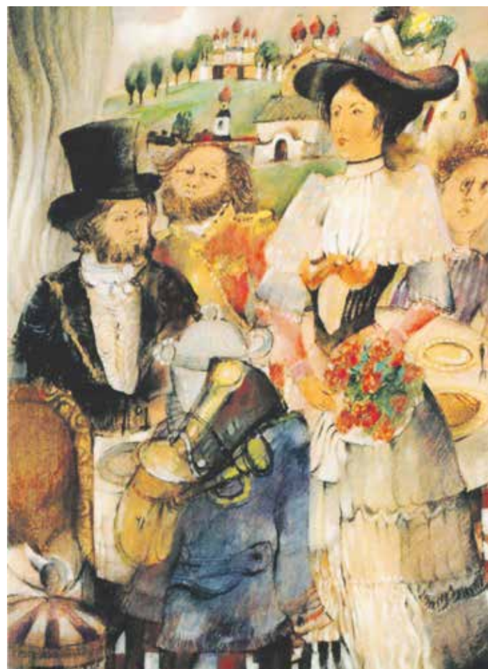
Ilustrace k povídce A. P. Čechova Pomluva, pastel, 1978.