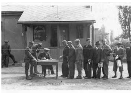
Narukování rekrutů k 8. pěšímu pluku slezskému v Místku.