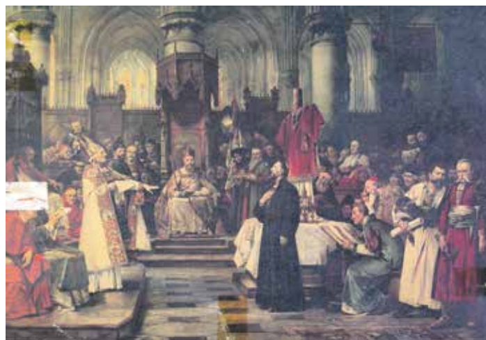
Školní obraz Jan Hus před koncilem kostnickým (vlevo). Pohlednice s motivem Václava Brožíka: Pasačka husí.

Václavu Brožíkovi – vysoce talentovanému, pilnému a obdivovanému malíři tzv. Generace Národního divadla – bylo dopřáno jen padesát let života, z toho čtvrtstoletí prožil ve Francii, hlavně v Paříži. Narodil se v březnu roku 1851 v Třemošné (nedaleko Plzně) do početné chudé rodiny soustružníka kovů. Ještě v dětském věku se s rodiči a sourozenci