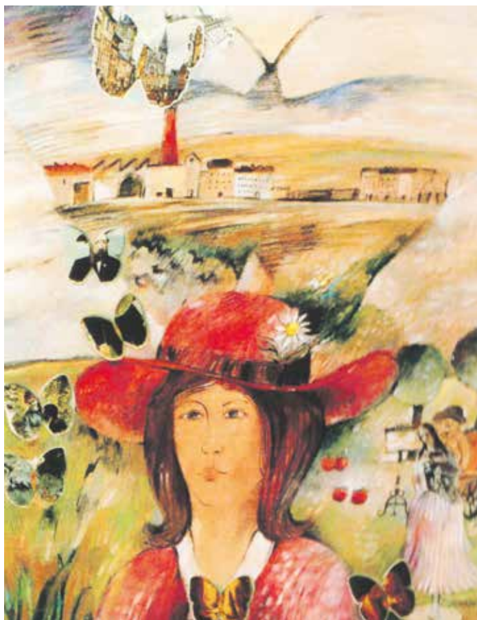
Vzpomínka, ilustrace, pastel, 1989.