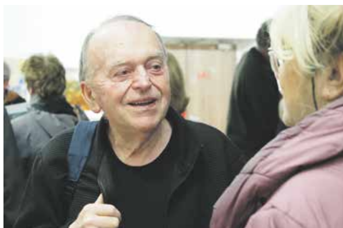
V rozhovoru s návštěvníci vernisáže výstavy ve Frýdlantu nad Ostravicí.

Ve Frýdlantu jsou moje věci k vidění opakovaně. Mám to zde rád a rád se sem také po letech vracím. Od první prezentace mé tvorby v roce 1971 už uplynulo více než dvaapadesát let. Z dlouhé řady míst, na kterých jsem samostatně nebo společně s dalšími umělci představil svá díla, bych vyjmenoval třeba Frýdek-Místek, Frenštát pod Radhoštěm, Havířov, Hodonín, Krnov, Nový Jičín, Ostravu, Olomouc, Opavu, Prahu, Příbor, Třinec, Vsetín – ze zahraničních německý Erfurt, italskou Novellaru nebo třeba slovenský Martin. Mé obrazy jsou zastoupeny ve sbírce Českomoravských odborových