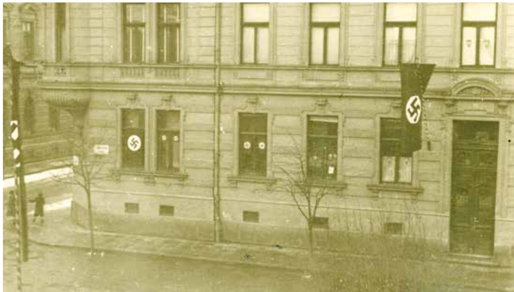
Budova na místecké Palackého třídě ozdobená vlajkami s hákovými kříži, 1939.