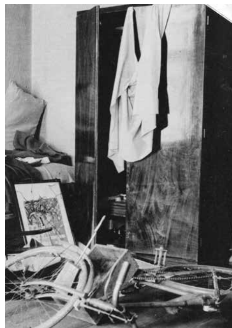
Interiér kasáren po zásahu nepřátelské střely, po vpadu německých vojáků (1939).