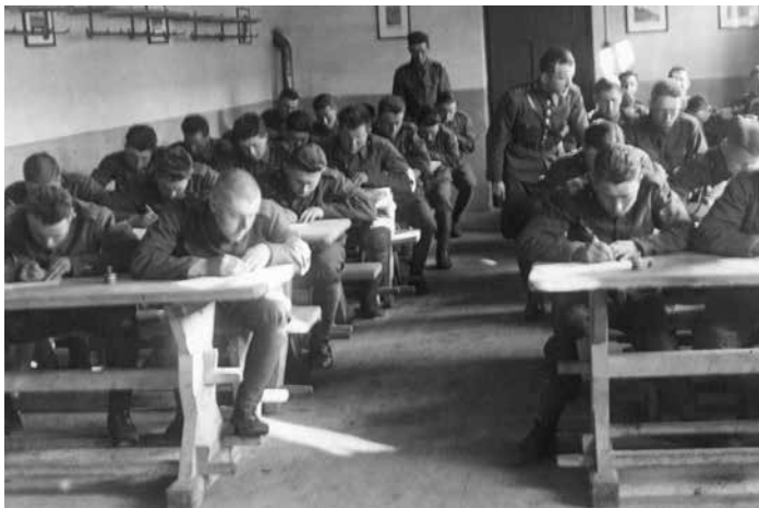
Školní místnost 8. pěšího pluku slezského v Místku.

jako okresní hejtman informován o jejich pohybu a měl za úkol zajistit koloně volný průjezd. Nařídil městské stráž, aby odložila zbraně, a stejně tak prý informoval místeckou vojenskou posádku v dnešní ulici Pavlíkova. Do Čajánkových kasáren už ale tato informace nedorazila, a tak byla tato posádka jediná v republice, která se Němcům postavila se zbraní v ruce.“ ■