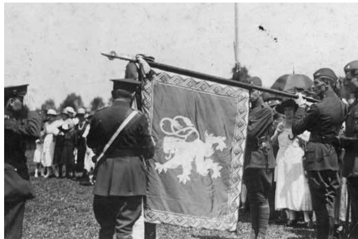
5. výročí založení 8. slezského pěšího pluku – dekorování plukovního praporu válečným křížem (1922).