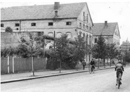
Bývalá Čajánkova továrna v Místku (1939), kasárna 8. slezského pěšího pluku.