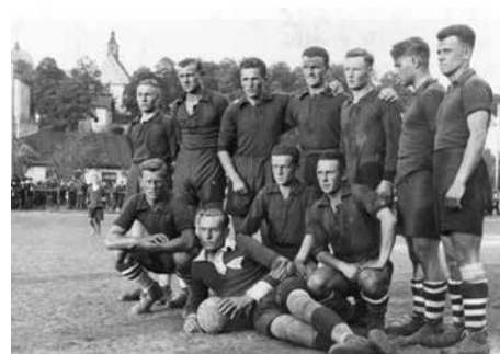
Fotbaloví hráči 8. pěšího pluku slezského na hřišti ve Frydku.