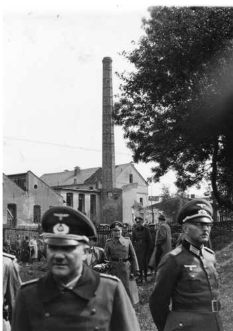
Demolice části Čajánkových kasáren (1940), v popředí němečtí důstojníci.