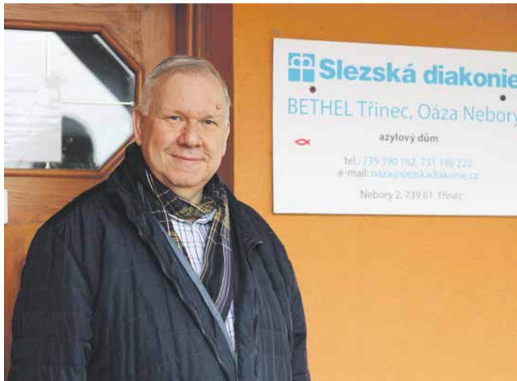
Koordinátor střediska Slezské diakonie Oáza v Neborech před budovou zařízení.

Všechno má svůj počátek v polovině 80. let minulého století, kdy jsem studoval na Vysoké škole dopravy a spojů v Žilině. Přestože tehdejší normalizační režim duchovní službě nebyl nakloněn, práce faráře byla podmiňována udělením tzv. státního souhlasu a v desítkách případů byli kazatelé i věřící pro svou církevní činnost trestně stíháni, dozrála ve mně touha stát se farářem a šířit mezi mládež evangelium. Po převratu,