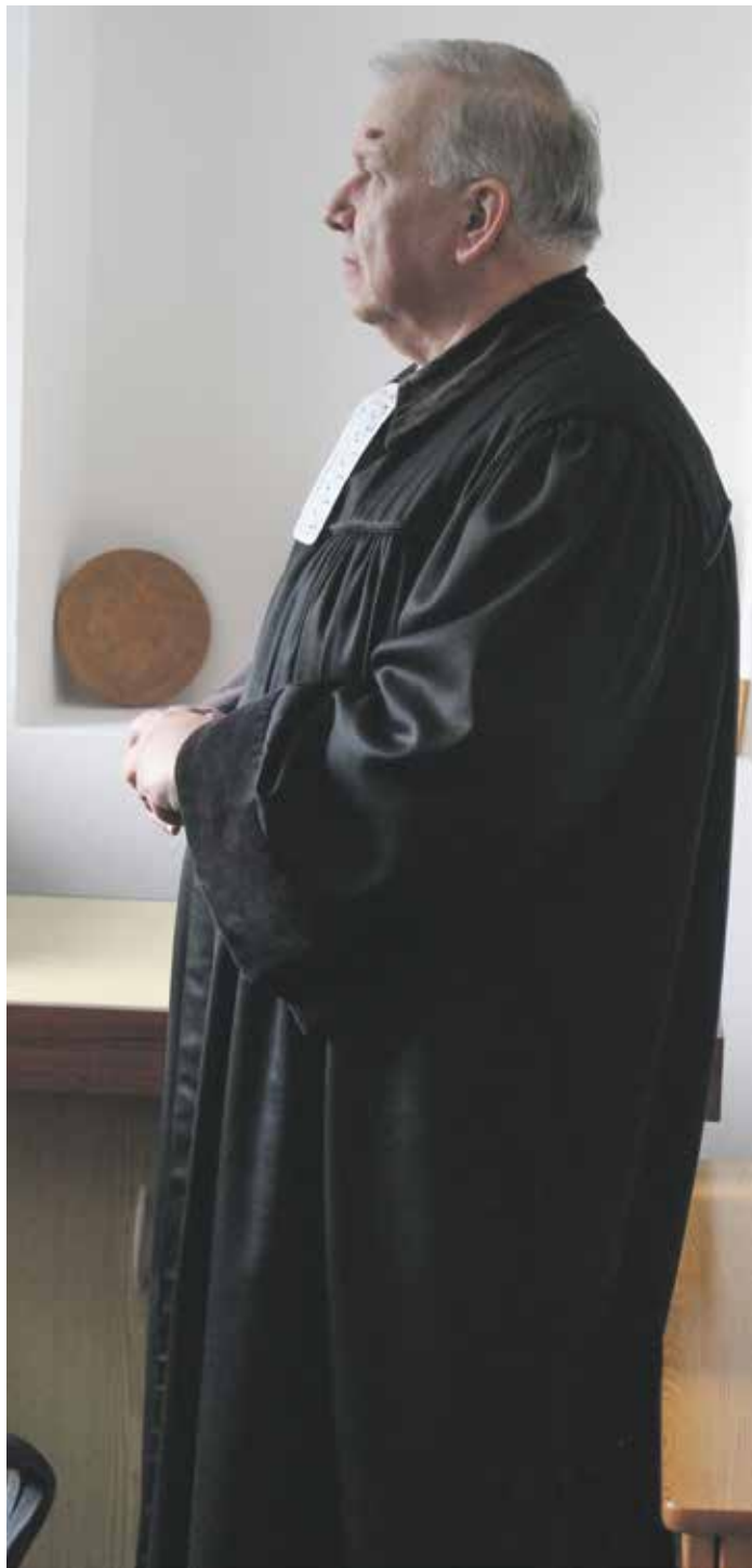
Chvilě rozjímání a modlitby před bohoslužbou.

Pokud nám sami neotevrou své nitro, víme o nich pouze to, co nám o sobě řeknou v tzv. pohovoru se zájemcem o naši službu. Kromě lékařské zprávy o bezinfekčnosti a o tom, že nemají žádné nakažlivé choroby, které by bránily pobytu u nás, nemáme žádné podrobnosti ani k jejich zdravotnímu stavu. Jsou bez domova, přicházejí většinou z ulice, kam se dostali po ztrátě zaměstnání nebo díky dluhům, které už nebyli schopni splácet. V neposlední řadě se bezdomovci stávají muži, kteří se rozvedli a byli vykázáni ze svých dosavadních domovů nebo z nich sami odešli. Nejsme zde od toho, abychom na nich tyto informace vyzvídali, ale potěší nás, když si vybudujeme vztah založený na vzájemném respektu a začneme o těchto věcech spolu hovořit. Pomáhá to zejména ve chvílích, kdy hledají a navazují zpět ztracené rodinné vazby. Vztahy mezi otcem a dětmi, mezi bývalými partnery, ale i třeba vztah syna a matky. Cením si momentů, kdy se mi někdo otevře: „Podařilo se mi hovořit s otcem. Zavolali jsme si a domluvili se na schůzce,