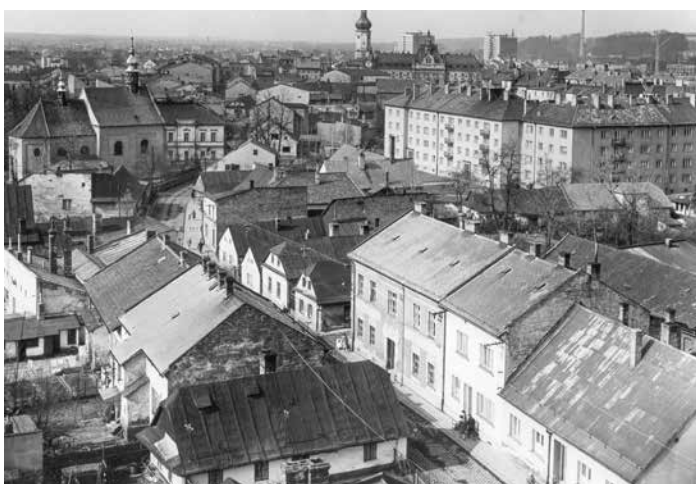
Stará zástavba ulice Frýdlantské, vpravo domy na ulici Sv. Čecha, 60. léta 20. stol.