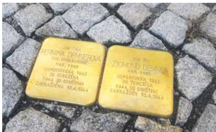
Nově položené vzpomínkové kameny manželů Demnerových.

Projekt Stolpersteine byl iniciován na počátku 90. let německým