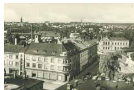
V popředí Hasičský dům, vpravo Český dům v Místku.