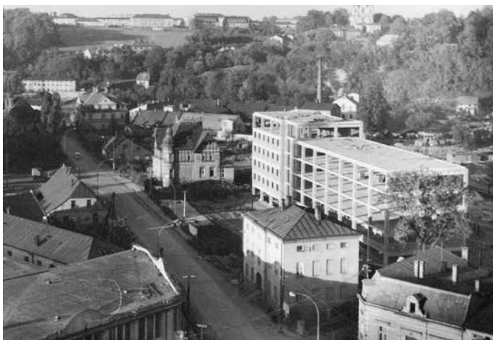
Ulice Pionýrů – pohled z ptáčích perspektivy.