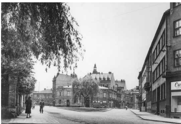
Malé náměstí v Místku s pomníkem padlým v I. světové válce.