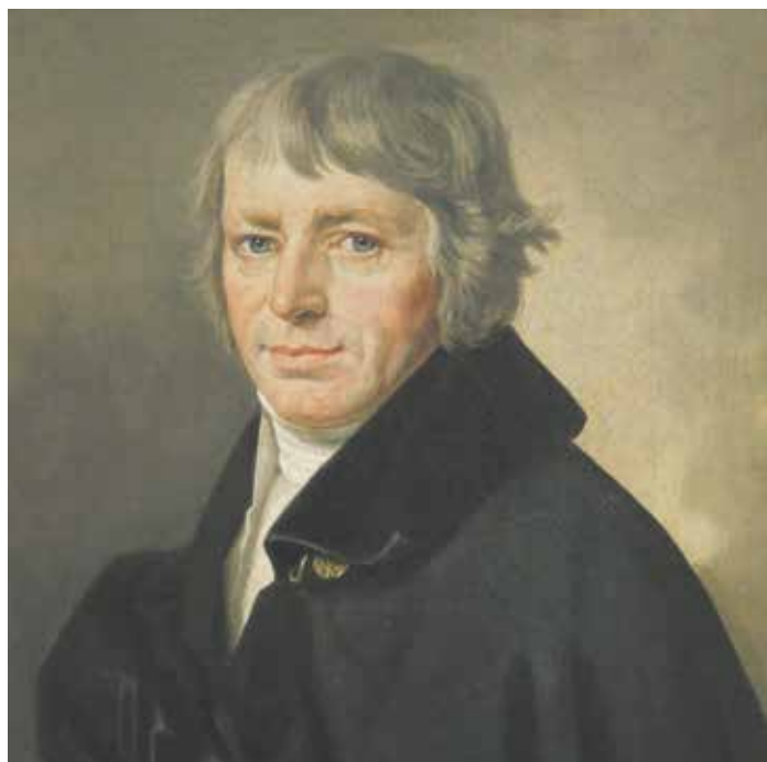
Portrét Josefa Jungmanna od Antonína Machka.

Narodil se 16. července 1773 v Hudčicích u Berouna jako šestý z deseti dětí. V Praze vystudoval gymnázium a na univerzitě filozofii. Zajímal se jak o přírodní vědy, tak historii a literaturu, překládal z mnoha jazyků. V letech 1800-1815 působil jako profesor na gymnáziu v Litoměřicích, poté odešel do Prahy. Zde učil na gymnáziu, byl zvolen děkanem Filozofické fakulty Karlo-Ferdinandovy univerzity. Spoluzaložil Sbor pro vědecké vzdělávání řeči a literatury české, stal se 1. jednatelem Matice české. Jím vydaná Historie literatury české je první české dílo svého druhu, je soupisem české literární produkce – dochované v rukopisech, v knižních nebo časopiseckých tiscích – od nejstarších dob po současnost. Zemřel 14. listopadu 1847 v Praze, pohřben je na Olšanských hřbitovech.