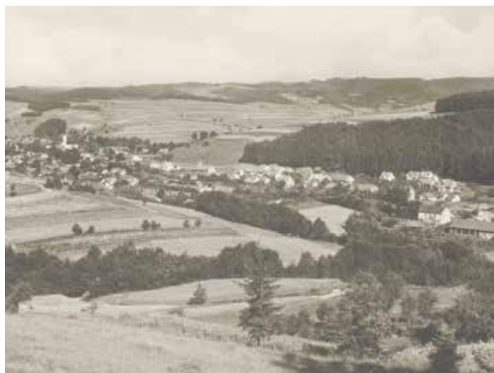
Ratiborč v 50. letech 20. století.