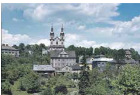
Bazilika Navštívení Panny Marie, 1974.