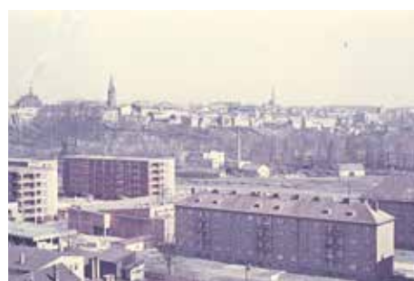
Panorama Frýdku z hotelového domu.