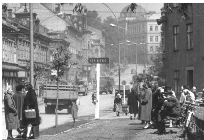
Pohled na třídu Rudé armády (dnes třída T. G. Masaryka) od Kostikovova náměstí.