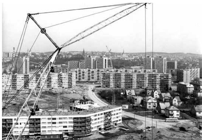
Část nového sídliště Kolaříkovo v Místku, 1973.