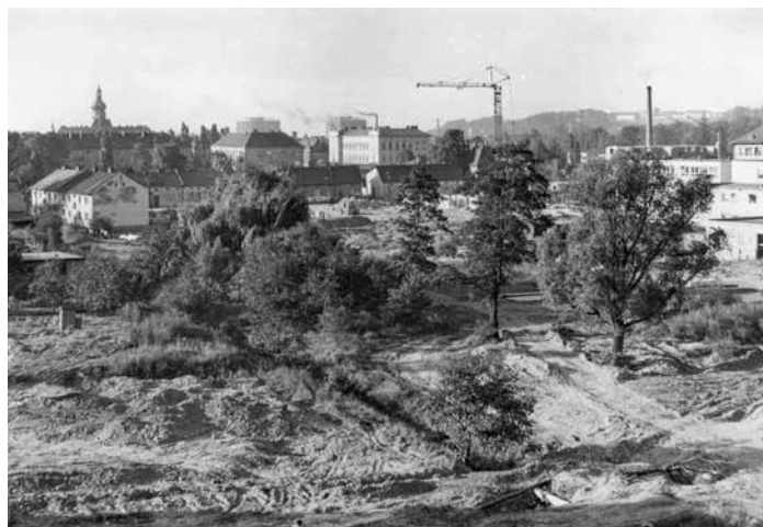
Výstavba panelových domů na Riviéře, odtud pohled na Frýdek, 1964.