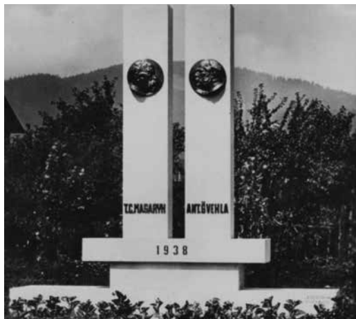
Původní pomník T. G. Masaryka a Antonína Švehly z roku 1938.

Pomník prošel nelehkým osudem. Slavnostně byl odhalen 7. srpna 1938. Dva třímetrové