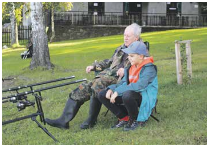
Společně se svým vnukem na oblíbeném místě přehrady Olešná.

Každý z nás ho má. Je jich bezpočet, ale uvedu jeden. Pocházím z Pobeskydí, rodiče měli hospodářství. Jednoho dne nám všem otec sdělil, že nás už naše půda neživí. Nestačí mít pole, dobytek, koně, když země dává více kamení než obilí a brambor. Můžeme se na ní plahočit a dřít od rána do večera a k ničemu to