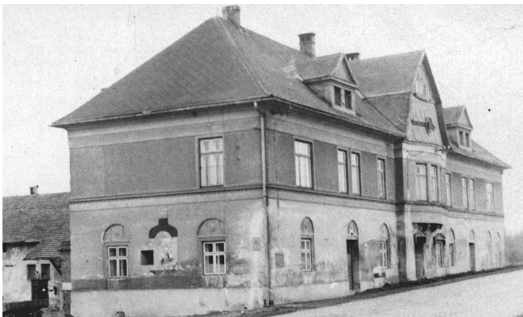
Budova bývalé Glesingerovy likérky ve Vojkovicích, dnešní Koničkův dvůr.