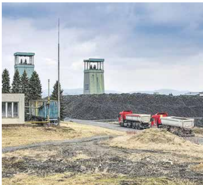
Na zasypání v areálu dolu má být použito zhruba 200 tisíc tun hlusiny.

Nyní je bývalý důl v „péči“ pracovníků podniku Diamo a těžní jámy jsou zasypávány. Diamo převzalo šachtu společně s dalšími utlumovanými doly OKD před dvěma lety. Obec Trojanovice už má připraven rozvojový projekt Cérka, v rámci něhož budou využity všechny prostory areálu. Hlavními důvody pro likvidaci bylo dlouhodobé nevyužívání k těžbě a s tím související vysoké