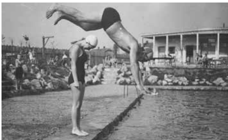
Koupaliště v Brušperku, konec 30. let 20. století