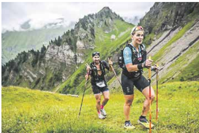
Stále ve stejném tempu, někde na 80. kilometru. Švýcarské Alpy mají své kouzlo.

Myšlenka založit nadační fond NEZÁVODÍM-POMÁHÁM, který by přinášel pomoc lidem, jejichž životy jsou limitovány různými