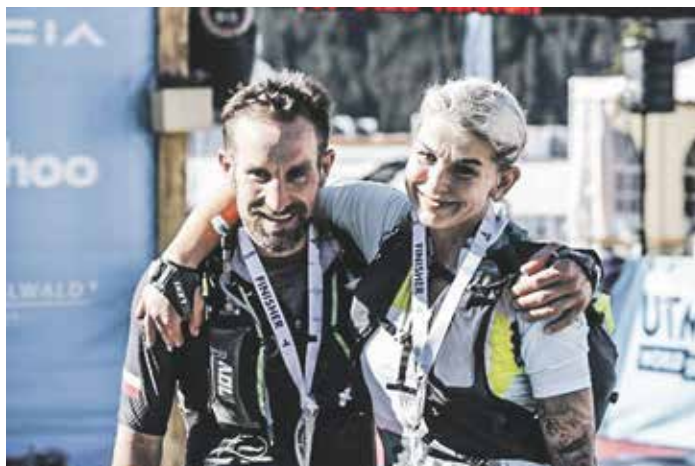
Zcela vyčerpaní, ale šťastní v cíli švýcarského závodu E250.