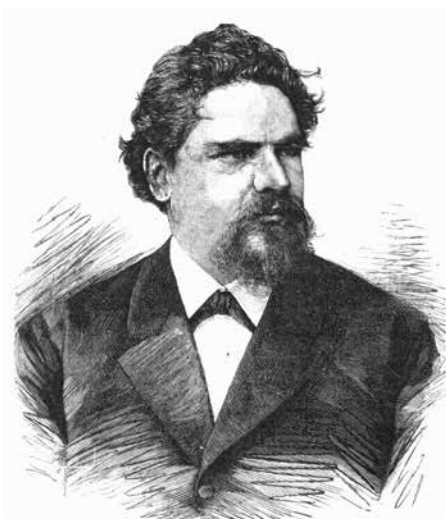
Zdeněk Fibich na dobové kresbě.

Hudební skladatel, sbormistr a pedagog Zdeněk Fibich se narodil před Vánoci roku 1850 do rodiny nadlesního ve Všebořicích u Zruče nad Sázavou. Na budově myslivny je od roku 1925 umístěna pamětní deska. Rodinné prostředí mu napomáhalo při rozvíjení hudebního