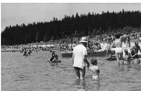
Přehrada Baška, 1967