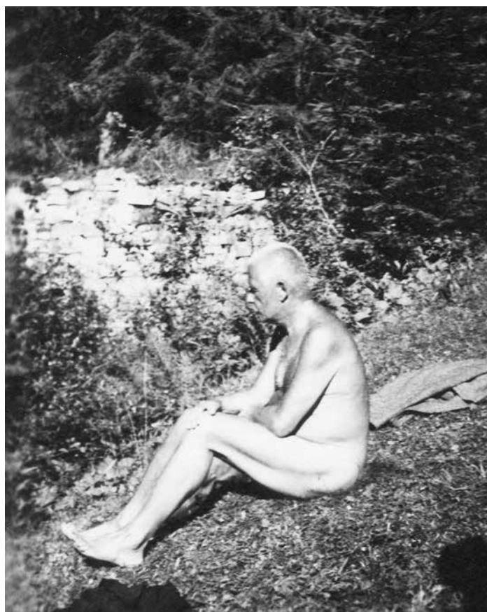
Relaxující Petr Bezruč, 30. léta 20. století