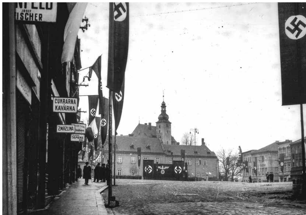
Frýdecké náměstí na jaře roku 1939.