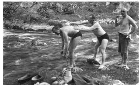
Koupání v řece, 20. léta 20. století