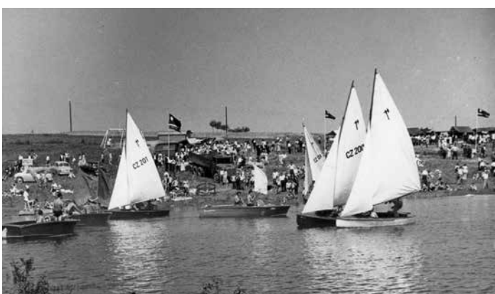
Závod plachetnic na Žermanické přehradě, 60. léta 20. století