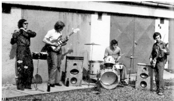
Na školní kapelu Brikety koks jsme navázali pod názvem Krystal.