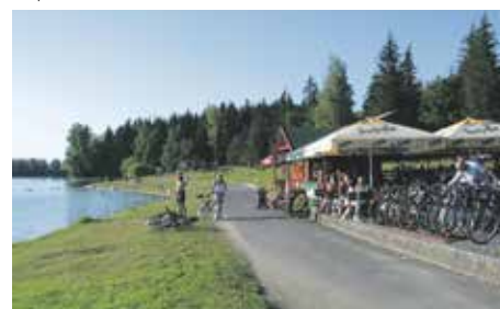
Přehrada Baška, 2008