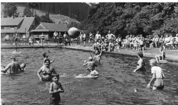
Rekreační středisko v Řeči, 1957