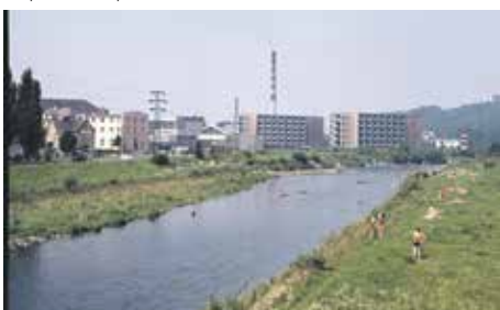
Řeka Ostravice ve Frýdku-Místku, 1974