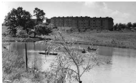
Lodky ve Stovkách, 1960