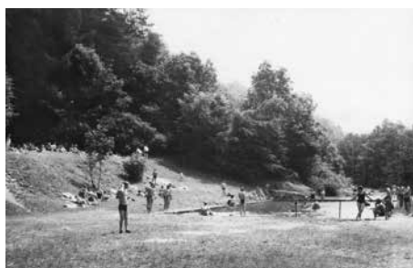
Koupaliště na Hukvaldech, 60. léta 20. století