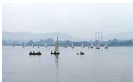
Přehrada Olešná, závod plachetnic, 1974