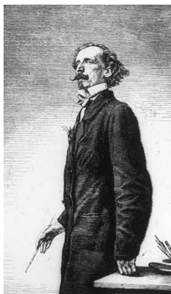
Josef Mánes – dřevoryt Maxe Švabinského z r. 1917.