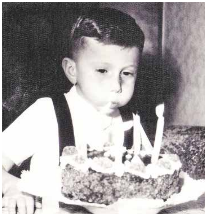
Páté narozeniny se nemohly obejít bez dortu.

Tehdy ještě ne, rybáři tam ale měli svou klubovnu. Později se tam provedly stavební úpravy, přistavěla se další část budovy a začalo to fungovat jako restaurace, kterou provozovali manželé Šulcovi. Oslavil jsem tam