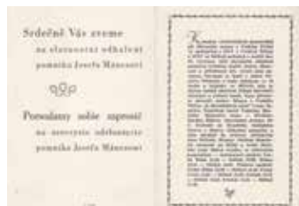
Pozvánka na odhalení pomníku Josefu Mánesovi.