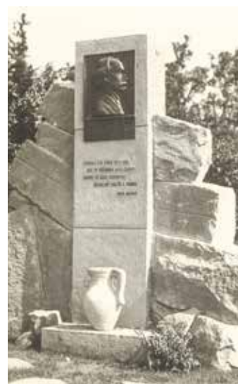
Pomník Josefa Mánesa ve Stříteži odhalený u příležitosti 125. výročí jeho narození.