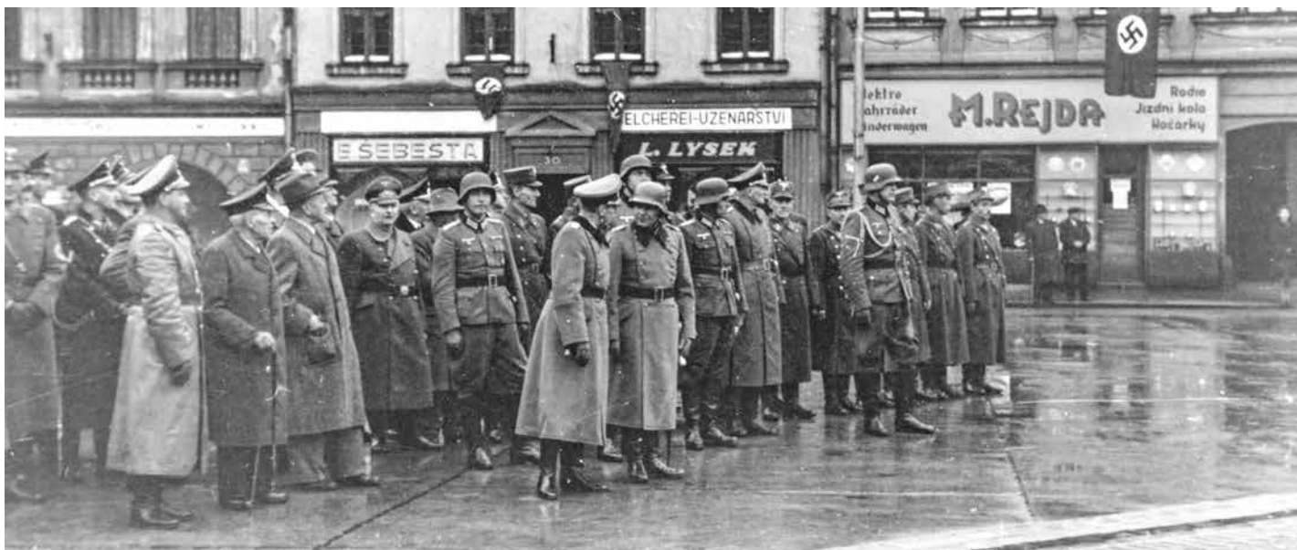
Místecké náměstí, němečtí důstojníci během vojenské přísahy rekrutů.