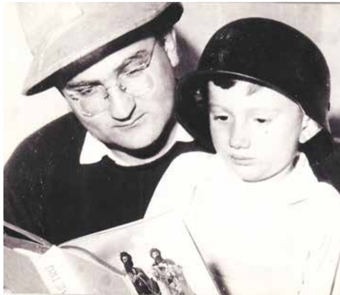
Rodinná pohoda s otcem, učitelem a později ředitelem na 5. ZŠ ve Frýdku.

Rozhodně! Mohl jsem si třeba déle pospat, někdy jsem vstával až