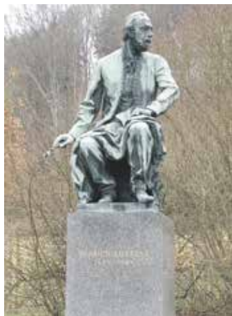
Socha Bedřicha Smetany v Karlových Varech.

Bedřich Smetana se narodil počátkem března roku 1824 v Litomyšli v rodině sládků. V deseti letech utrpěl úraz, po němž mu zbyla částečně deformovaná tvář, skrývaná později plnovousem. Gymnázium studoval v Jindřichově Hradci, maturoval v Plzni. Poté odešel do Prahy, kde se věnoval komponování, vystupoval jako klavírista, otevřel také