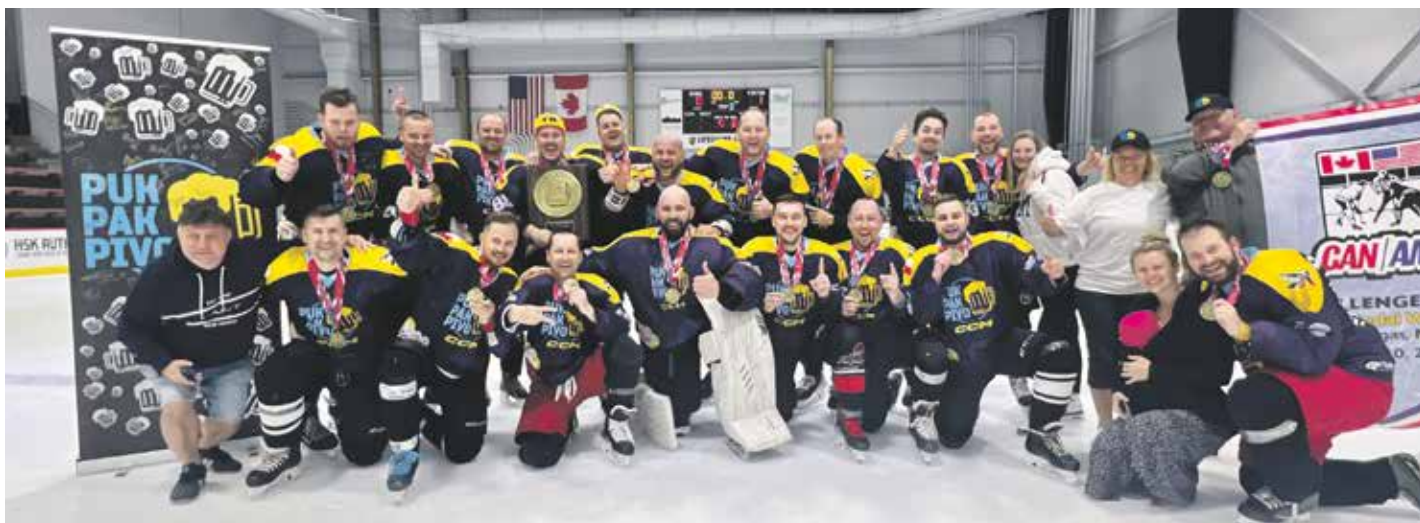
Kompletní výprava českého hokejového týmu Puk Pak Pivo po vítězném zápase finále turnaje v Las Vegas.