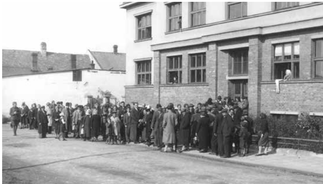
Osoby evakuované z Těšínska čekající na oběd před budovou chudobince na Školské ulici v Místku, listopad 1938.