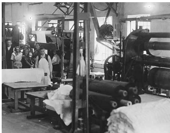
Zaměstnanci pracující v kalandrovně raškovické úpravy, 40. léta 20. století.

Abychom si mohli konkrétně představit, jaká byla kupní síla pracovníků Kirchhofovy továrny, můžeme si pro srovnání uvést ceny některých základních potravin v té době. Ve 20. letech 20. století, tedy v období hospodářské konjunktury před nástupem velké celosvětové hospodářské krize, se litr mléka prodával za 1,90–2,05 Kč, kilogram brambor za 0,55–1,05 Kč, kilogram másla za 25,00–26,50 Kč, kilogramový bochník chleba stál 2,50–3,40 Kč, kilogram pšeničné mouky se dal koupit za