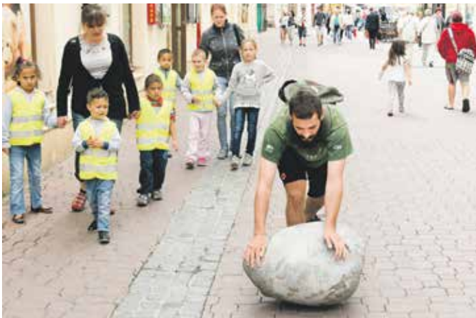
Součástí šestého ročníku festivalu Sochy v ulicích v Brně byla performance nazvaná Balvan.