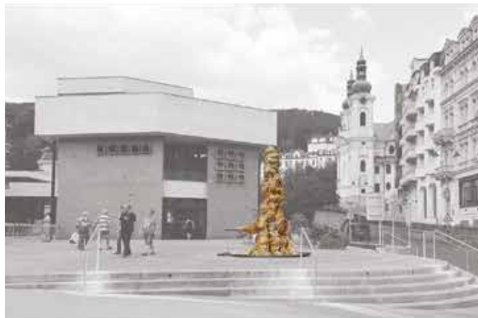
Pitko Krasavec v Karlových Varech bude díky sedimentaci vrátdlovce měnit postupně svou podobu.

zamezil. Uvnitř je umístěn malý ventilátor a systémem průduchů proudí vzduch, který vyrovnává vlhkost. Vlastně je to celé taková kutilská podivnost vyrobená na koleně. Po těch letech se v čase adventu občas procházím kolem a jsem velmi potěšen z nadšených dětských komentářů. Někdy u něj vidím celé třídy ze školek a škol – z toho mám nefalšovanou radost. Zpětně si také uvědomuju a vždy mě dojíká, jak hrdý na mě byl můj táta, když chodil čistit ta skla umaštěná od dětských tváří.