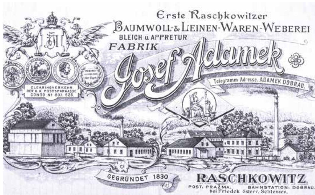
Adámkova továrna v Raškovících, na veduté podniku jsou zachyceny jednotlivé provozní a obytné budovy, před rokem 1911.