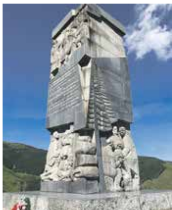
Pomník Jana Švermy v Demänovské dolině na Slovensku.

Jan Šverma se narodil do rodiny advokáta 23. března 1901 v Mnichově Hradišti. Studoval na gymnáziu a po maturitě přešel na Právnickou fakultu Univerzity Karlovy, studia však nedokončil. Levicové smýšlení ho přivedlo do řad komunistické strany, kde od jejího vzniku patřil k předním