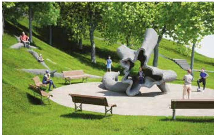
Vizualizace Morysova vítězného projektu Lípa, který se bude realizovat v prostorách zámeckých teras pod zámek Žerotínův a Valašském Meziříčí.