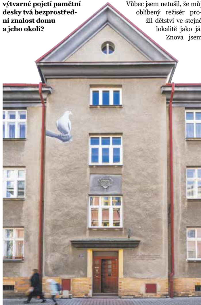
Netradiční pojetí pamětní desky na domě ve Skolské ulici v Místku, který obýval filmový režisér František Vlácil.

Toto místo má pro mě symboliku mého dětství. Jen pár desítek metrů od tohoto domu jsem vyrůstal, navštěvoval základní školu, hrál si s dalšími dětmi na hřišti i v přilehlém parku. V domě naproti pracovala moje maminka a do Vlácilova domu se asi před rokem nastěhoval se svou rodinou jeden z mých kamarádů. Umožnil mi, abych si prošel dům od sklepa až po půdu, nasál a vstřebal do sebe jeho historii a atmosféru.